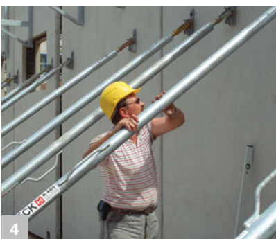
4 Sicheres und einfaches Befestigen der Strebe vom Boden aus.