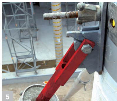
5 Vereinfachte Demontage durch Trennung der Strebe vom Schnellverschluss am Fertigteil.