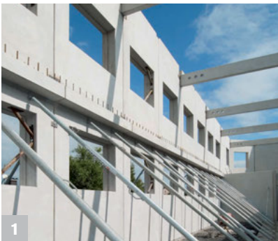
1 Gutes Tragkraft-/Eigengewichtverhältnis mit 5 Streben für den Auszugsbereich von 2,05 m bis 10,25 m.