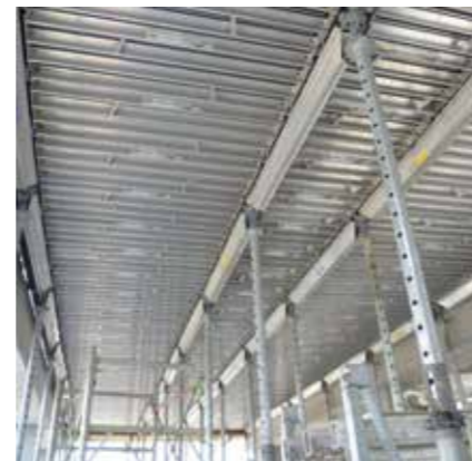
► Jedes Trägerelement wird am vorherigen eingehängt.