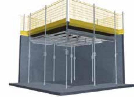
► Rundum gesichert durch einfache Montage der Absturz-sicherung