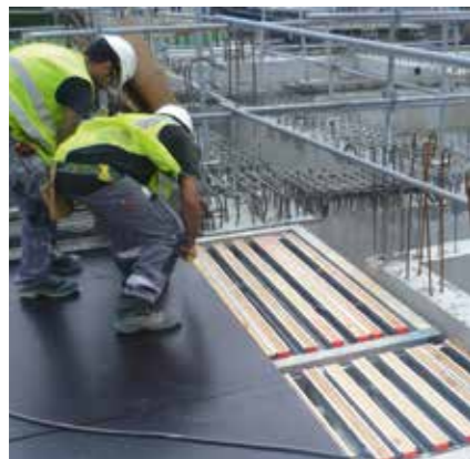
► Die Schalhaut wird von oben auf die Trägerelemente gelegt.